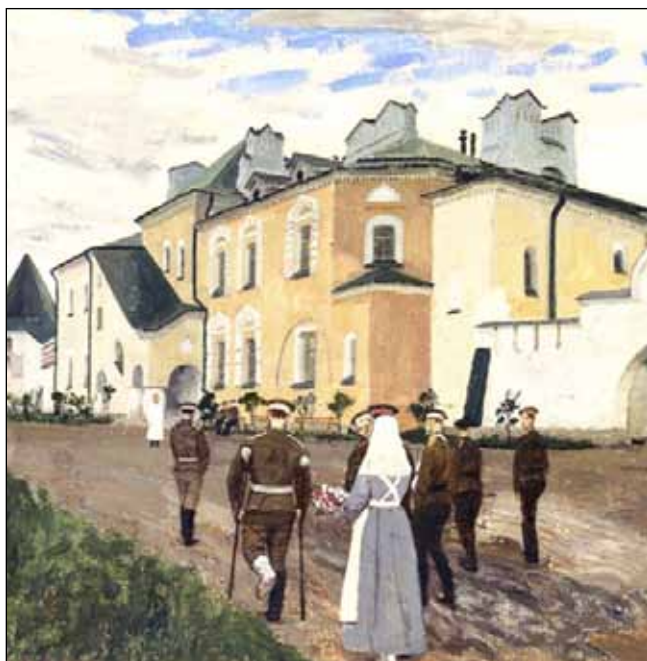
Солдатский лазарет. Г.Н. Горелов, 1917 г.

дровича Кокорева (Московская ул., 55). После смерти купца его сын подарил здание Санкт-Петербургскому женскому